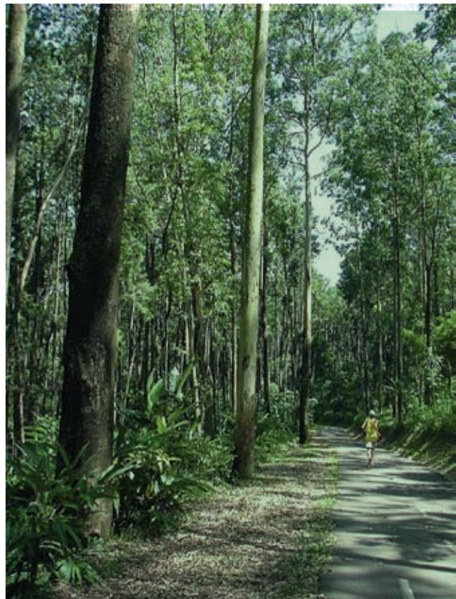
Cooper pela mata nativa é um dos atrativos do Anhanguera

O Jornal Urbano foi conferir o que há de melhor nesses parques. Desligue a TV, saia do sofá, junte seus familiares e amigos e vá curtir um dia cercado de natureza e paz.