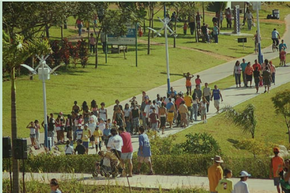
Parque da Cidade, em Jundiaí, oferece atividades diversas para todas as idades

uma ducha ou bebendo água nos diversos bebedouros disponíveis pelo caminho. O Ponto de Encontro, área reservada para pequenas apresentações culturais, é a alternativa para quem deseja assistir apresentações culturais. Espetáculos maiores, como os shows da Virada Cultural, acontecem no palco do anfiteatro, que possui capacidade para até 30 mil pessoas. O parque também possui playground para as crianças, mesas de jogos (xadrez, dama e dominó), duas quadras poliesportivas para a prática de basquete, vôlei, futsal e han-