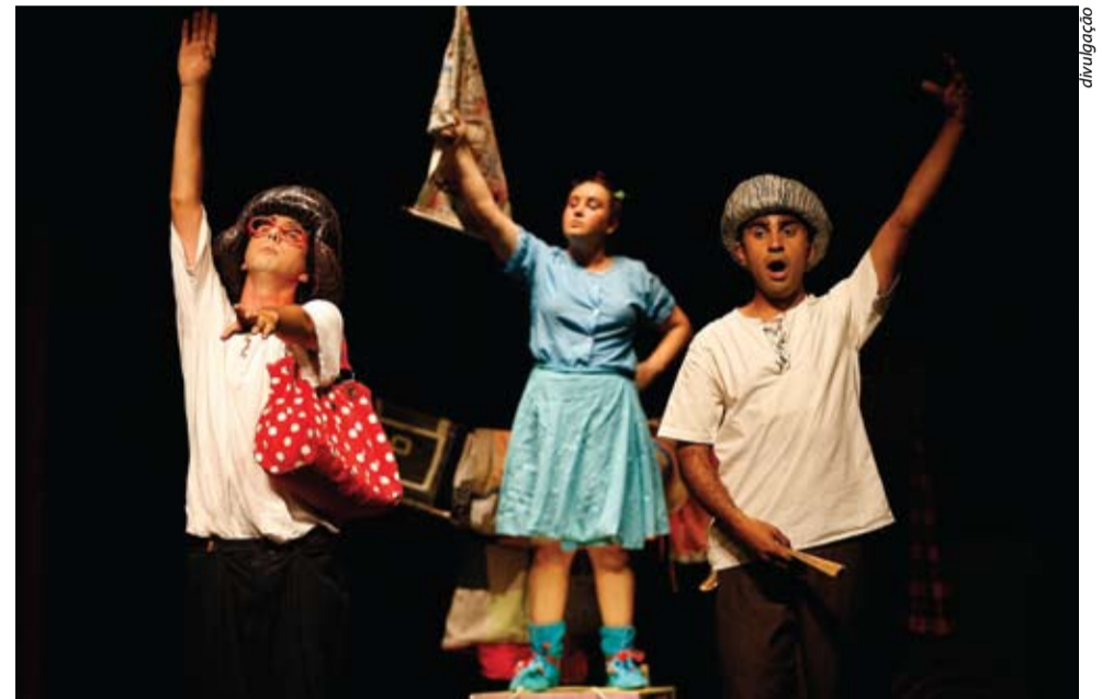
Teatro Girandolá - de Morato para o Brasil, há dois anos fazendo arte

bolo de aniversário, os artistas arrumaram fôlego extra para comemorarem o aniversário da cidade, convidando os cidadãos a cantar e assoprar as velas do bolo de papel. Veja a programação completa e conheça os outros projetos do grupo em www.teatrogirandola.blogspot.com