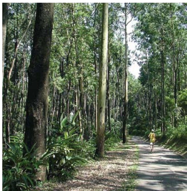
Cooper no Parque Anhanguera