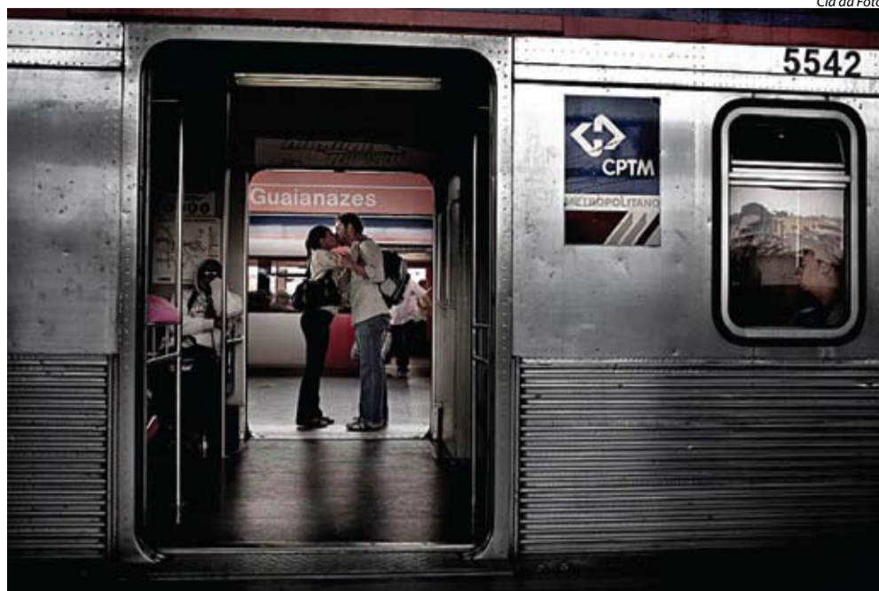
Cia da Foto

Lentes dos fotógrafos da Cia da Foto capturaram a correria e romance nos trens