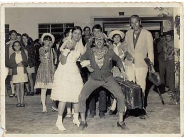
Arriaiá de antigamente juntava todo mundo pra festa!

O griô é aquele que vive percorrendo as cidades para transmitir a tradição dos ancestrais para as novas gerações. Saiba mais sobre essa figura na coluna de Helena Katz, na página 2.