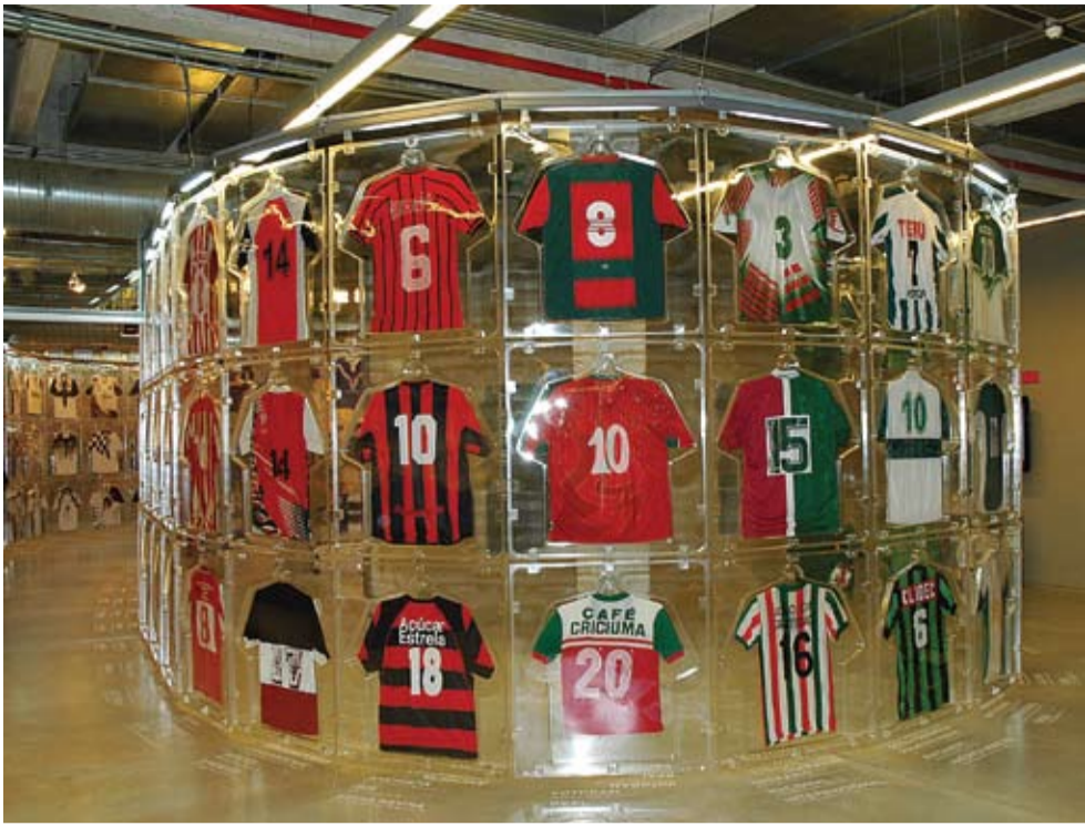
Mais de 1.800 camisas de times de futebol do Brasil inteiro em exposição até dia 16 de agosto

Barras Futebol Clube, Associação Desportiva Granjense, Pantanal Futebol Clube e Clube Esportivo Paysandu. Se você nunca ouviu o nome dessas equipes, provavelmente não imagina como são as camisas utilizadas pelos times de futebol acima citados, respectivamente originários do Piauí, Ceará, Mato Grosso do Sul e de Santa Catarina.