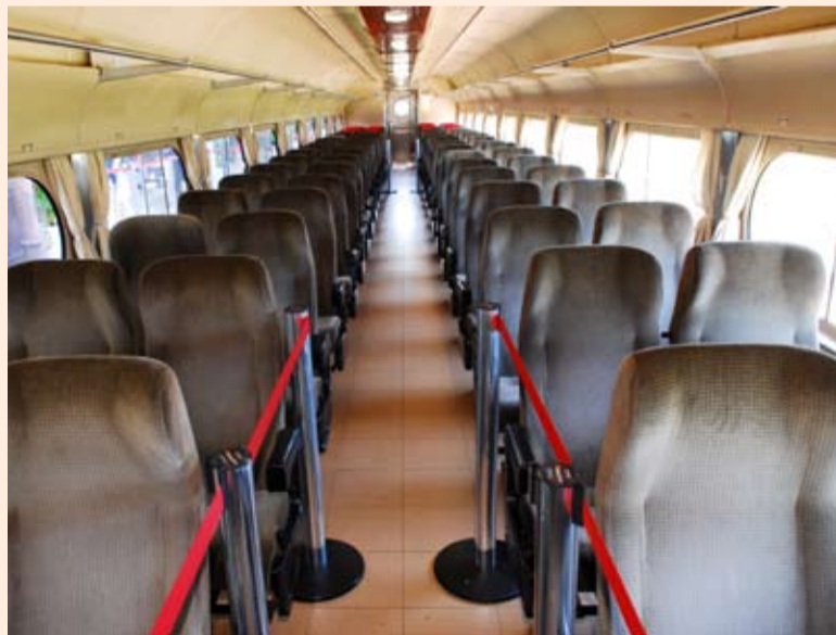
Conforto em viagem por estrada de ferro inaugurada em 1867

A viagem até Jundiaí segue pela estrada de ferro implantada em 1867 pela antiga São Paulo Railway Co., empresa de capital inglês responsável pelo impulso inicial ao desenvolvimento econômico do estado. Foi a primeira ferrovia de São Paulo e ligava Santos a Jundiaí, a fim de trans-