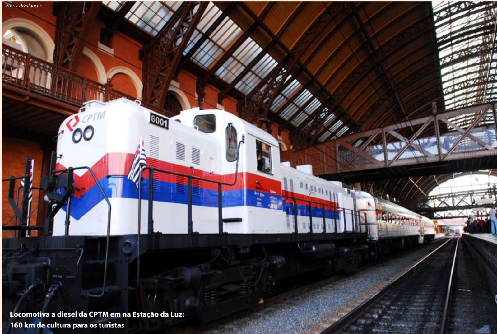
Locomotiva a diesel da CPTM em na Estação da Luz: 160 km de cultura para os turistas

Está em funcionamento do Expresso Turístico para Jundiaí. Partindo da Estação da Luz, é a possibilidade dos passageiros fazerem uma viagem no tempo por uma das mais importantes ferrovias do país.