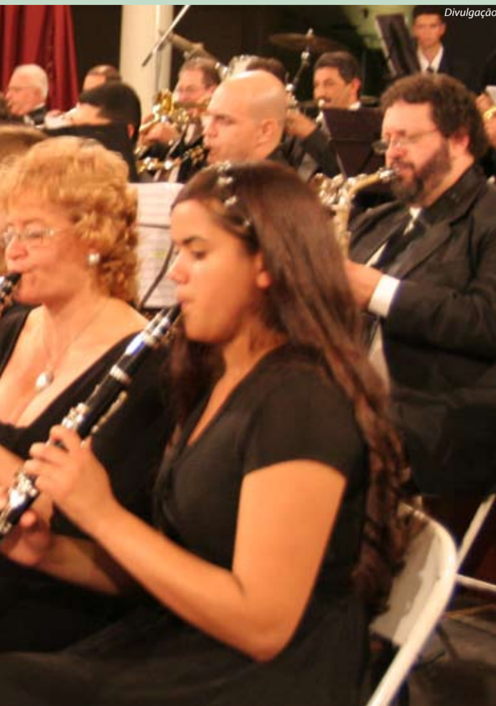
A Orquestra em 1921 (abaixo) e atualmente (ao alto): talentos musicais atravessam gerações.